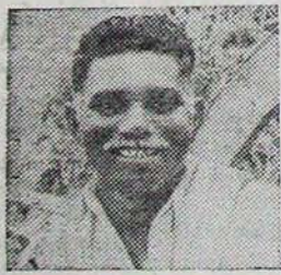
కె. నాందారయ్య గుర్తవర్గం మండలం కృష్ణా జిల్లా-521 356 బంగారు పంట ఎకరాకు 3000 కిలోల దాకం

కోరమాండల్ ఫెర్టిలైజర్స్ లిమిటెడ్ 126, నరసింహ రోడ్, హిందూరాజు-500 003