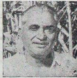
కె.వీ. అప్పారావు గుర్తవర్గం తాలూకా వికాపల్లెం జిల్లా బంగారు పంట ఎకరాకు 50 టన్నుల దాకం