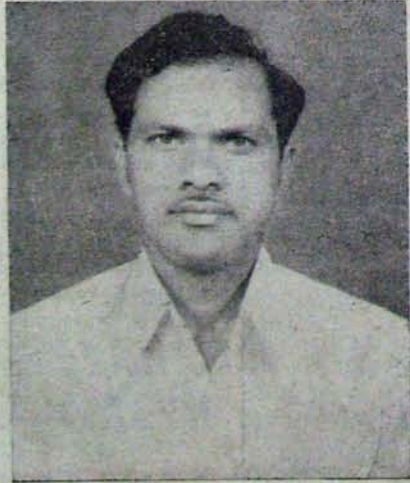
పూజ్యులు - అప్పీయులు