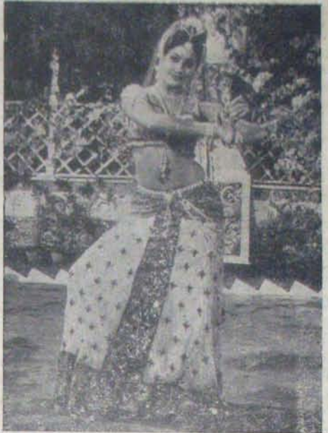
‘ముద్దు’ కృష్ణయ్యలో విజయవాడలో సర్వభంగిమ

తినుకరావాలనుకోవడం వాటిల్లమే అనే చక్కని అభిప్రాయం. ఒక ధనవంతుల కుటుంబంలో కీర్తి చరి గా ప్రవేశించిన లోని పిల్లలకు అపహాసం వల్లనే అంటి లోని పిల్లలకు మజంబట్టి, బుద్ధి చెప్పి, క్రమశిక్షణలో మంచివారు తిద్దిదిద్దు కాదు. ఈ పాత్ర భానువందరకీ దొరకడిం అతని అదృష్టం. దానికి తగ్గుతు దొరికిన అవకాశాన్ని సద్వినియోగం చేసు కుంటున్నాడు. ఎప్పుడూ ప్రేక్షకులలో విసుగెత్తిపోయిన భానువందరకీ జనాదరణ విధిస్తూనే ఉన్నాడు. అతని శిష్యులారాగా అమల అనే అందమైన బెంగాలీయవతి వదిలింది. శరత్ కామలు, సత్యనారాయణ, వేలు, జెనక్రి, ఎన్. వరలక్ష్మి, మాస్టర్ హరి, జెబీ సిక, పార్థసారథి, జితన్ పాల్గొన్నారు. మాటలు: గెటెడ్ పాల్, మ్యూజిక్: చక్రవర్తి, తెలుగు: సుధాకర్ రెడ్డి, దైర్యం: ఎ.కామలం ద్ర రావు, ఎన్.కామలం ప్రాధాన్యం: ఎన్, కృష్ణప్రసాద్ రెడ్డి, పుల్కెట్ లో మాటింగ్ పూర్తయి, మేలో విడుదలవుతుంది. ఈ చిత్రం రచ్చారచ్చ శోభిస్తుంది. విజయవాడలో నాలుగవారాలుగా ఈ సినిమా కడుదరిచిత్రాన్ని చూడడం ప్రదర్శన కర్తవ్యం నిర్మిస్తుంది. ★