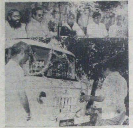
జిల్లాపరిషత్ పరీక్షలలో పాల్గొన్న అంధ అభ్యర్థులకు అనుమతి ఉంది. అంధులైన విద్యార్థులు పాఠాన్ని పరీక్షలు (క్రింది లెవెల్) ప్రాప్తించు అంధులు, అటువంటి అభ్యర్థుల పరీక్ష అనుభవించిన అనుమతి ఉంది. దాని విషయం 'స్ట్రైట్ స్టోర్' నియమించడం