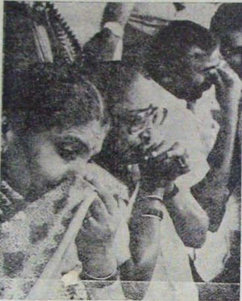
రామకృష్ణ హెడ్డె గాతీనామాకు కంటతడి పెడుతున్న కొందరు కర్షకులకు ఐనతా కొనసాగుతున్నారు