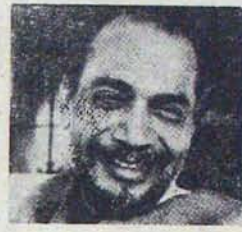
రామకృష్ణ హెడ్డె పార్లమెంటు ఎన్నికలలో కర్ణాటకలో అధికారంలో ఉన్న తన జనతాపార్టీ ఉడిపోయింది; కాంగ్రెస్ కు కౌశలం

హెడ్డె నీతినిజాయితీలకు ప్రతిక అని, ఒడిదుడుకులు లేని పెద్దమనిషి అని పేరుంది; కర్ణాటక ప్రజలలో మంచి పట్టు వుంది. అందువల్లనే అతను ప్రజాహితీ తీవ్రంగా ఉన్న ప్రమాణాలమీద గట్టిగా నిలబడి గలుగుతున్నాడు; విజయకు కాగలుగుతున్నాడు. హెడ్డె ముఖ్యమంత్రిత్వానికి రాజీనామా ఇవ్వడం ఇది వెంటపాతి.