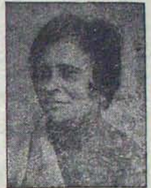
నివాసు రాజభవనంలో కాదు. ఎప్పుడూ ప్రజల మధ్యనే! బాసడం పొరపొటని నిజులైనవారు తెలిసి కొంటారు. అలమైన శేంద్ర నాయకత్వాన్ని ఏమిచేయలేని నిస్వహాయులు -కొరక 7వ పేజీలో

గవర్నరు శ్రీమతి కమండరాజ్ కోపి మీద ముఖ్యమంత్రి రామాచార్యులో ఈర్వాసూయానిజాబుర్దాయా? దీక్షంకడదంకాదు; అది వారిద్దరిమధ్య వ్యతిరేకతగా మొరైత్తి వనలు తొడుగుతున్నట్టు ముద్రానునుండి వెలువడే అంగదిన క్షత్రిక "స్వాస్థీ కుడే" ప్రకటించిన ఒక హైదరాబాదు కథనంవల్ల రెండువర్షిది, ముఖ్యమంత్రి రామాచార్యుగారికి అనలు గవర్నరు పదవి అంటేనే గిట్టదు; అవి రద్దుకావాలనేవాళ్ళలో ఆయన మొదటివాడు. గవర్నరు తదవులమీద ద్వేషం ఆయనకు నిర్మితంగా ఏర్పడలేదు; గవర్నరు రాంలాల్ తనను పక చ్యుతుణ్ణి తోకడనేది అతని ఆశ్రోకం. శేంద్ర నాయకులు అదేకాలం అమలు జరపడంలో గవర్నరు శేవలం నిమిత్త మాతుడని; ఏదైనావారికి అది వారికి వ్యక్తిగతంగా అపాదించి వారిమీద ద్వేషం