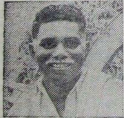
కె. నాంబరదయ్య గుడ్లపల్లి మండలం కృష్ణా జిల్లా-521 356 బంగారు పంట ఎకరాకు 3000 కిలోల రాబట్ట

కొంమాండర్ ఫెర్టిలైజర్స్ లిమిటెడ్ 126, నల్లకొండ రోడ్, హైదరాబాద్ - 500 003