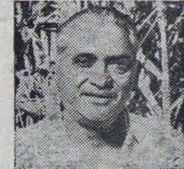
కవ్వీ అప్పారావు దాకరం తాలూకా విశాఖపట్నం జిల్లా బంగారు పంట ఎకరాకు 50 టన్నుల రాబట్ట