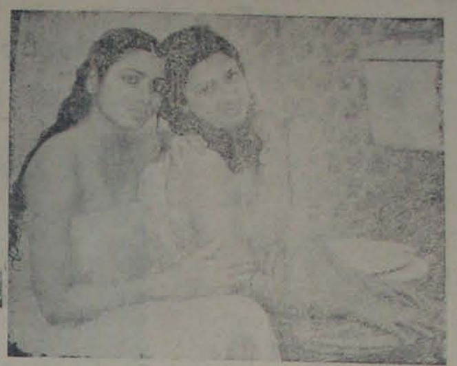
'విలపిత' వ్యవస్థలో నికారెడ్డి, జీవిత

ఈ ఒక రోజు: పీడిత వారి ద్వారా వచ్చాయి. దీనిని అర్థం చేసుకోవడానికి ప్రతిఘటన వచ్చాయి. దీనిని అర్థం చేసుకోవడానికి ప్రతిఘటన వచ్చాయి.