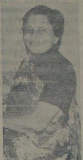
అంధ్రప్రదేశ్ కొత్త గవర్నర్ కుమారి కుముద్ బెగ్ జోషి

'శ్రాంతివంతు' కూడా అచ్యుతవంతు వంతువలనోంది. ఈ వందల శ్రాంతి 'తెలుగు శ్రమ దళం' కు వందలవందలకాం వామినేషా వంతు అచ్యుతవంతువలన, ఈ దళం అతులంవలన మించి వంతు అచ్యు గివంతులు: శ్రమదళ వాయుకుడు యాలైకాతం శ్రమదళంలో ముందు వచ్చి మందం తెలిస్తూ అరికారికి దింపిం దు 16 శేషిలోగా దళవంతువంతు అ దళవంతువచ్చింది శిల్లా అరివచ్చి మందలి వలించింది 1986 అనవని 10 శేషివలన అమోదముద్ర వేస్తుండం: శ్రమదళం యాలైకాతంకోకు కో ర వ యాలైకాతం 'వస్తు వందలం' యవం లో ప్రభుత్వం వంతువంతువంతు: ఏ వ వి అచ్యుతనా యాలైకాతానికి మించి తే అ అదరవ మొత్తాన్ని ఆ శ్రమదళం తలించాలం, మూలంగా ఇది ఆ వందలం పారాళం. -కొకవ 7వ పేజీలో