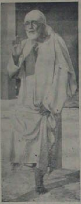
శ్రీ వీర్ల సాయిబాబా మహాత్మ్యంలో విజయవందర

గణంలో కరణక గజేంద్రాజీ తెర క్షణిక ఒక చిత్రాన్ని తీసువచ్చారు. తెలుగు రాజులు ఏ. ఎన్. ఆర్. ప్యాని తెర క్షణిక ఒక చిత్రాన్ని పూర్ణ చేస్తున్నారో. వచ్చే కంపెనీకుం మరీ కొన్ని ప్రయోగాలు చేసి, వందల సంవత్సరాల వరకు వచ్చారు.