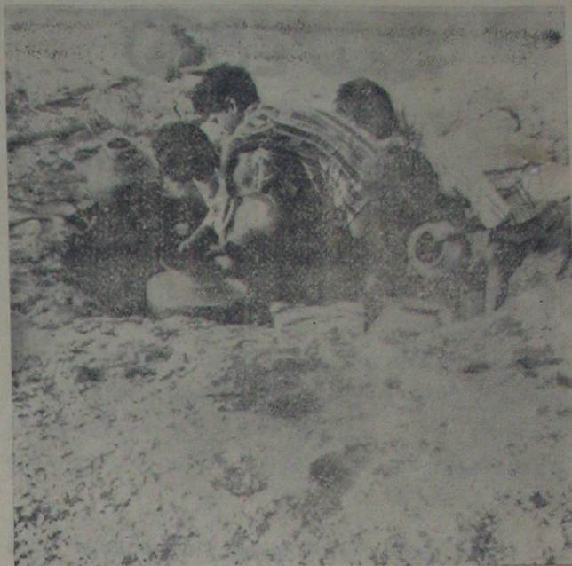
కండుకూరు తాలూకా సారేడులో చెంపల రోడ్డి గంటల వక్రంకం వీడు దొంగలొంగుతున్నారని తెలుస్తోంది.

మునిసిపల్ కమిషనరే ఇంటి దొంగలెత్తుతున్నారని తెలుస్తోంది. మునిసిపల్ కమిషనరే ఇంటి దొంగలెత్తుతున్నారని తెలుస్తోంది.