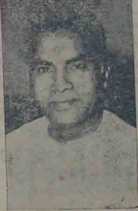
నాదెండ్ల గెలిస్తే అసెంబ్లీ మరొకసారి రద్దు?