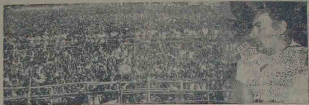
27 తేదీ నెల్లూరు నరలో ప్రధాని రాజీవ్ గాంధీ