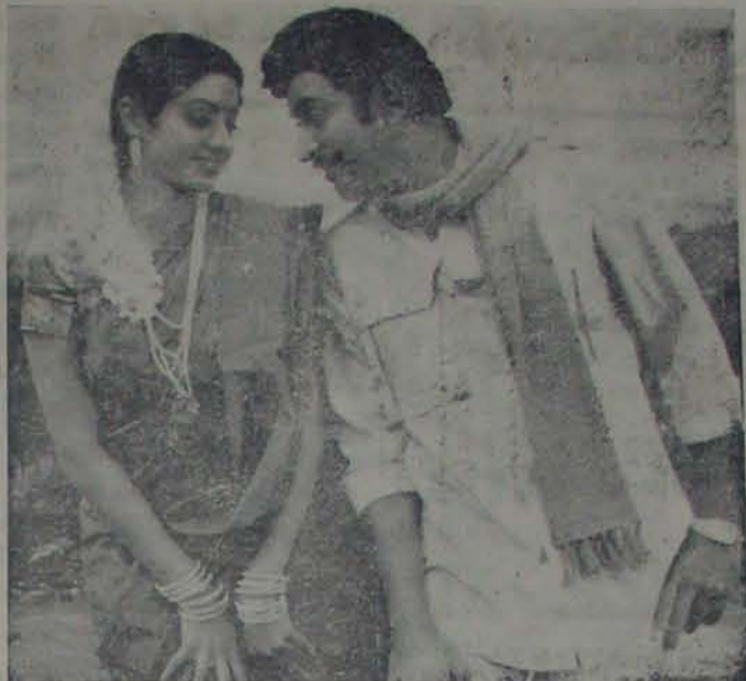
ఎవరి మనసుపై ఎవరు విజయం సాధించారు? - 'జయం మనదే' లో వెన్నెముక కృష్ణ, శ్రీదేవి

మంజుభార్గవి చిత్రం గురించి ప్రచారం చేస్తున్నారు. గుంటూరు లో కళాసౌఖ్యం, కానీ, మంజుభార్గవి చిత్రం గురించి ప్రచారం చేస్తున్నారు. గుంటూరు లో కళాసౌఖ్యం, కానీ, మంజుభార్గవి చిత్రం గురించి ప్రచారం చేస్తున్నారు.