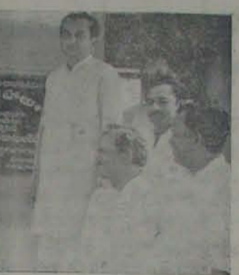
కుల్చూరు సభ తిరుగుబాటు దారులదా...