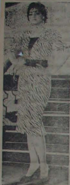
సాగనుకు ఉపమానం తానేనంటుంది