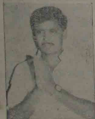
నెల్లూరు అసెంబ్లీ నియోజకవర్గం తెలుగుదేశం పార్టీ అభ్యర్థి