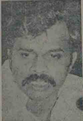
ఎప్పుడో జరగవలసింది! చుకు ఉదాహరణగా వల్లించమంది పోటీ చేస్తున్న ముఖ్యమంత్రి కామలావైపు పోటీకి కామరంద్రారెడ్డిని ఎంచుకోవడాని

గెలుపును సులభకరం చేసేందుకు కాంగ్రెస్ పార్టీ అత్యధులుగా ఏనకితెలియని కొత్తవారిని, జలహీనమైన అత్యధులను ఎంచుకోవడాని అయిన చెప్పారు. ఇం