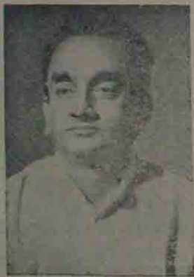
కోపూరు అసెంబ్లీ నియోజకవర్గం తెలుగుదేశం పార్టీ అభ్యర్థి