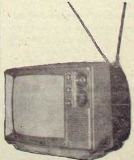
BALAJEE Monomax-14 Portable B/W

Also B & W 20" Sets with and without Shutters with Competitive Price & Effective After Sales Services. Ready Stocks available for other Trade Enquiries, Please Contact SALES MANAGER.