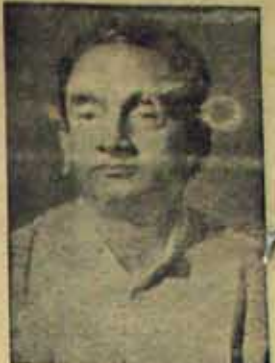
ఒకరిని అక్షేపించదగిన స్థితిలో లే!

జిల్లాకు జార్జరెడ్డి ఏమి చేశాడు... ప్రతిష్ఠను దిగజార్చుకున్న నల్లప రెడ్డి శ్రీనివాసులు రెడ్డి!