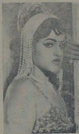
కొంబెమాపుతో పెదవి విరుపుతో జయమాలిని పిలుస్తుంది గర్లనలో నేనున్నా. రా. రమ్మని!

దీంతో విద్యార్థులు మరింత విజయించు న్నారు. జన యువకలంపై ఎలాంగీ దువ్వరికాకం, దువ్వరి వం కకగి ముందో యిదించేవలే తేక, అకానా, ఏ. శో పెక్కిగా కొవ్వర్లు కేయిదిన చిత్రాలు దాగ అకటకన్నా అంత అడిగితే: కళ లో నూ, కలంకలోనూ వకళుకు చూపించుకా పోవ్వకలో ఎంక వకళుకు చూపిస్తే పిం ప్రయోజనం: కాపి, విద్యాకలంకు పారిపారి పారిడి. ఒకేముసాలో సినిమాలు ఇటీవల విడుదలైన "వైరి" గళింక రేక, "వంకంపం" ఏకాకం వ: వం పం కలిగించడం జకా. అకెలమలోనుకీ కొచ్చిదిల్లా కలమూలంకన్నా, జరకొల దేనిలో ఎక్కువగా వదివేలో దిగివల్ల కొనుగోయిదారులను వచ్చుకలిపిస్తున్న చిత్రాగే. అకల "విశ్వం... కిష్టం" ఏకాలు వదికాదు ప్రేకతులు ఏకలెల్ల కాల్యకలంకీ హీరు ఎంబికల పెక్కి కొకున్నాడు. ఈవిషయం విద్యాకలంకు తెలియకాదు, కాపి, కొనుగోయిదార్లు "మిరిగిం" ఏచ్చి ప్రెక్టోకేన్నాయి" అని అకటగుతున్నాకటా. కలావేంకె ఇంకే: లాకవడుతుంది - అనుకుంబు న్నాడు దా లా మం ది అకటర్లెన్సి వ విద్యార్థులు.