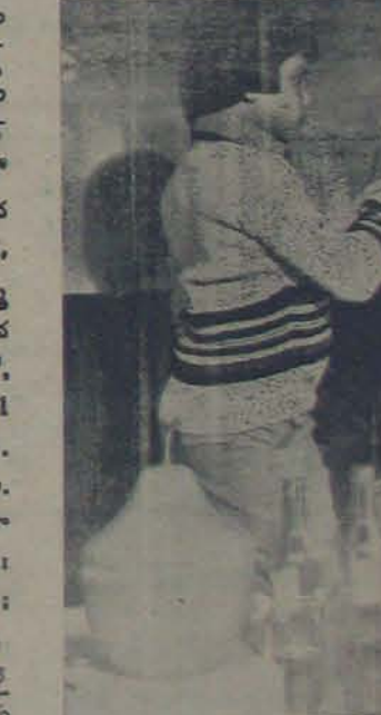
ప్రాంతీక 'వక్రం మసాలా' హీరో కేమితెలుసు - చూసినా వ్యకలంక

గోపాలరెడ్డి నివసించే ప్రజలకు ప్రేక ఏకృతేంది. తిన్నబడెల్ చిత్రం "నూ వరలో గోపాలం" మ మూవర్ హీరో చిత్రం కేకాడు. వకళుకొకగా కల విధమయికే చి. చిత్రాన్ని ప్రాకంరించడు. ఈయన నిర్మించే కర్ణ ప్రాకకన్న 85 చిత్రం "ముద్దుల కృష్ణయ్య" కు అగన్స్ 65 ప్రసాద్ ముడియో 70 ఎం. ఎం. తియిల్లో మొదటి పాటకు రికార్డేకాడు. వంక మూరి కాల్యవ్వు, విజయకాంతి, రార, గొంపూడి మాకుతిరావై, ఎన్. కలంపి విక్రం ముప్పగువాడు వదిస్తాడు. ప్రాధ కాణకలో పెన్సియర్ 7, 8 కేకలలో, మద్రాసులో పెన్సియర్ 18 నుండి 31 వకళు మొదటి సెడ్యూల్ జరిగుతుంది. మాటలు: గజేంద్రప్రసాద్. పాటలు: ఏ. నారాయణరెడ్డి, వంగీకం: కె. వి. చుంపూ దేవక. కె. మోహన్, ఏ. కమ్మకా, అద్దూ: కె. రామలింగేశ్వరకావై - దా మ్మయ: కనమలకలంక, కో. కైరకేరక: కలెన్సి ప్రాధికాన్నికాటిన్: ఆర్. ఏ. దొరై స్క్రిప్టర్లు, కళకళకళకళ: కోడి రామ కృష్ణ.