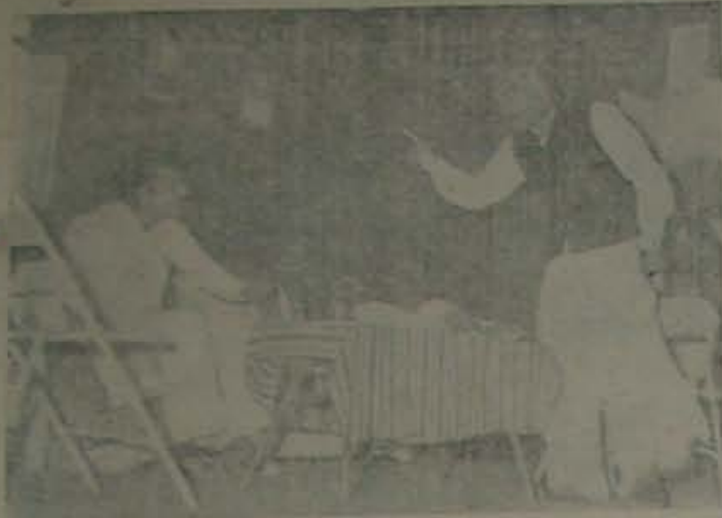
విజ్ఞానలో జీవనం ప్రదర్శించిన 'ఇటీ మన ప్రగతి' వాణికోట్ లోని పాఠశాల, బళ్లారి