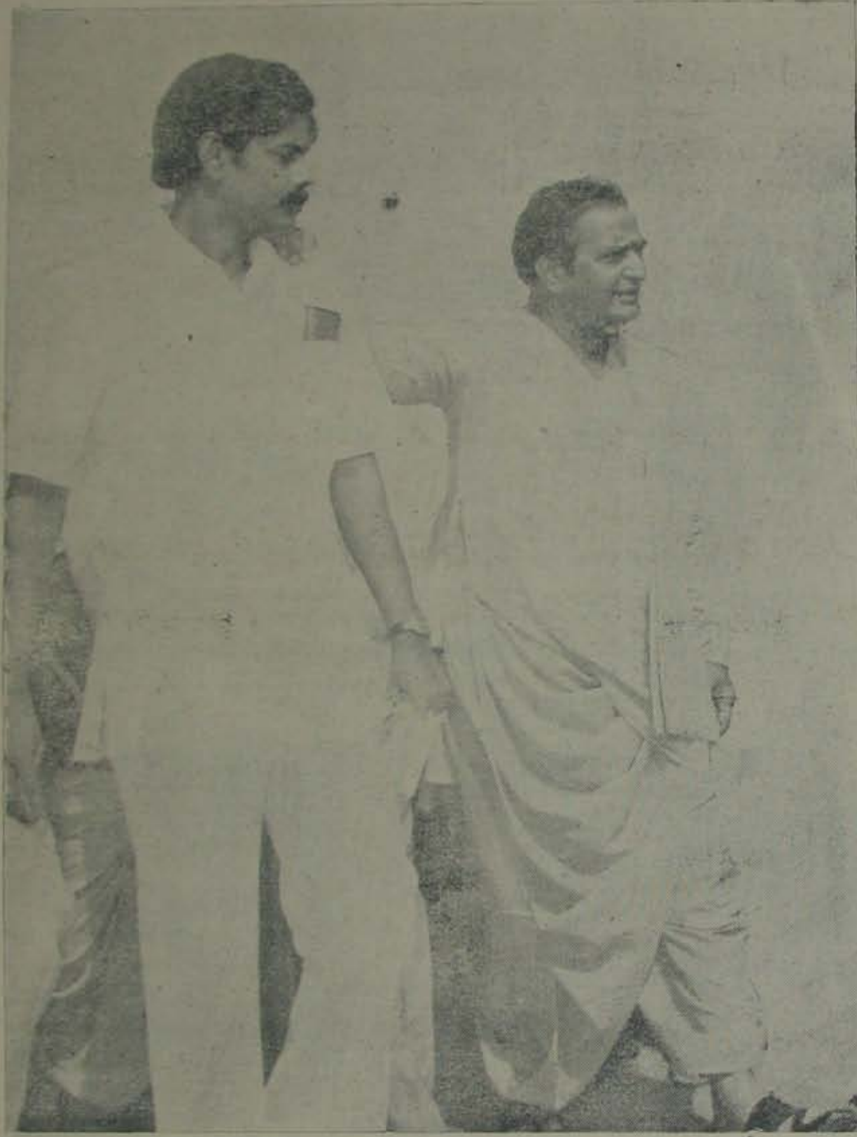
పెద్దన్నతో చిన్న తమ్ముడు