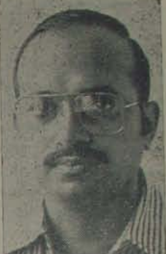
Dysfunction Unit) కూడా వచువే కున్నాడు. అక్కడ వెక్సు విషయంలో నలహాను య వ్యవం. చికిత్స చేయడం జరుగుతుంటుంది. -కోరవ 10 పేజీలో

లేదా అదివల అయ్యారు. డింకోపాటు డి. వగర్ గోపాలకృష్ణారావులో 'దేగా కృష్ణ' అనే పేరుతో ఒక వెక్సు వర్ డై వ రం క్షణ మూసెట్ (Sexual