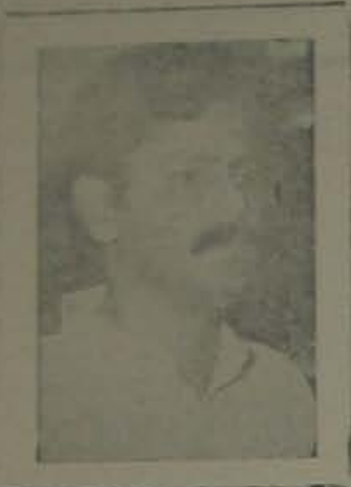
లాస్ ఎంజర్స్ ఒలింపిక్స్ క్రీడాలోకంలో ఏకీకృతవళాక రెవరెవలావారి!

సింహపురి రాజకీయకాళంలో దృవతారగా వెలుగొందుతున్న నెల్లూరు శాసనసభ్యులు, అంద్రప్రదేశ్ రాష్ట్ర శ్రీశామండలి అధ్యక్షులు