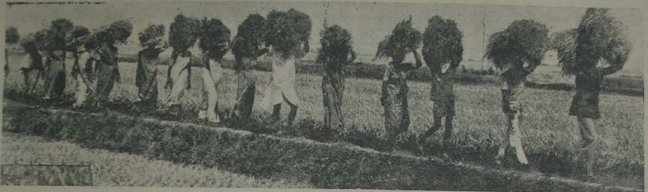
నెల్లూరుజిల్లా పల్లెసీమల్లో నేడు నేత్రపర్యం చేస్తున్న సర్వసాధారణ దృశ్యం

ప్రతిపక్షాలన్నిటికీ నేను మీ పక్షమేనంటున్నాడు