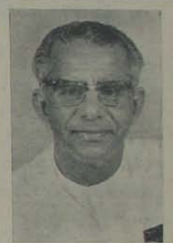
శ్రీ వెన్ మృతి

కలకత్తా వమానేంలో ప్రజాకార్యక్రమాలలో భాగస్వామిగా వర్తించే దైలాగునే ముఖ్యమంత్రి తిరిగి వర్తించే కొరవ 12 నేటికే