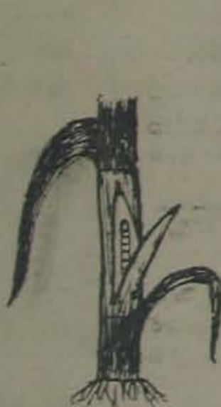
కాంచన లోయరు వరుగు (పాముపిప్పి)