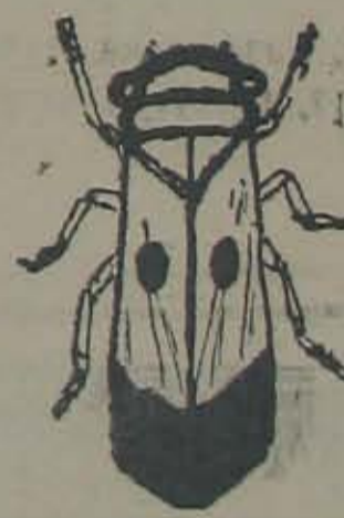
వచ్చుకోడు (ఐంగ్రో. తిరిగించు కోడు)

మరి వీటన్నిటినీ సమర్థవంతంగా నాశనంచేయడానికి కానాలిమీకు శక్తివంతమైన