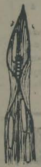
అకులొయరు పు. గు (తెల్లతెగులు)