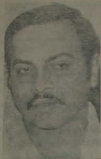
జంధ్యాల దర్శక నంది

దర్శక జంధ్యాలను ప్రశంసించే ప్రయత్నం. దర్శక జంధ్యాలను ప్రశంసించే ప్రయత్నం.