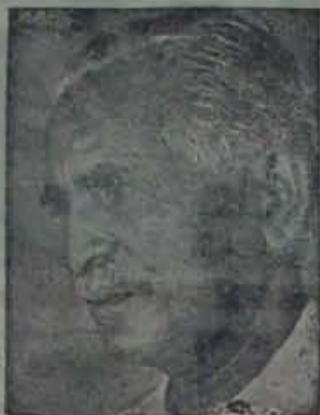
పొదిలన్నది అతిదెంగడు ఎదుకొండం దూకులొక పెం యేడు చందము. అతని దెంగడు

అతడొక నిర్ణాంత కర్త. అతడొక రద్దాంత కర్త. ఎప్పు యైననుగాని క్రమిక యెడరంను మీ రెడి ప్రవృత్తి. కమ్ము నిర్ణాంతమ్ము వేదము న్యాయవేడుగులెవని వారము కారీకంకై వీడికుంకై రర్మమొనెగుర్చుచే వినారము మొగరెడగును. ఎదు కొమ్ముం వగ్గమెడగును. దుర్మకట్టిన ఉగ్గమెడగును. ఏడవకం లెగ్గమెడగును. అతరెవరంట. చుట్టినవీకెడు వానినెవ్వరు మహారాజుగా మంద దలచెను? చెరుట రెడినవ మట్టి నెవ్వడు నీడం గంరము గాగ రంకెను?