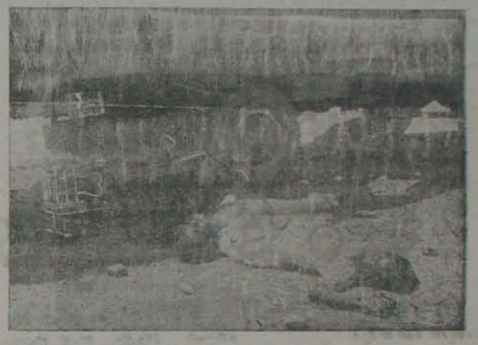
శ్రీలంకా దళాల్లోని 23 తెల్లవారి అధికారులు యువకుల్ని అరెస్టు చేసిన తరువాత

వికృతిని ఆదుకోండి. ఆదుకోండి. ఆదుకోండి. ఆదుకోండి. ఆదుకోండి. ఆదుకోండి. ఆదుకోండి. ఆదుకోండి. ఆదుకోండి. ఆదుకోండి. ఆదుకోండి. ఆదుకోండి.