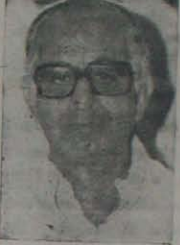
'హిందు' వికృత సంపాదకీయాలు చిరకాలంగా ఒకటివ్యాపిస్తుంది. ఏ విషయం యాన్నయిన సమగ్రంగా చర్చించడం.