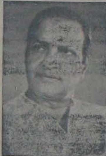
యూపిఎం నైపుణ్యం దండులున్నట్లే భావిస్తున్నట్లుంది. కాను ముఖ్యమంత్రి

'అన్న' గారి నోరు మరీ హద్దు వద్దు లేకుండా పోతున్నది. ఆ నోటి కోసే, ఆ పెదబొట్టెం గర్జనలతోనే ఆయన అధికారానికి వచ్చాడు; అందులో సందేహంలేదు, కాని ఆ నోటి కోసే ఎల్లకాలం జరగదు; ఆ నోటి కోసే వరిపాంస సాగదు; ఆ నోటికి ప్రజలు కాళ్ళ కంఠం మోసపోరు; ఆయన ధాటిని తెలిసికోలేనందువల్లనే ఆయన విజృంభణ రోజులూ ఒకటి ఎక్కువవుతున్న దేమో వదిలిపెట్టింది. 'అన్న' గారు ఇంకా ఆరు నెలల పాటు వున్నాడు; ఆ ప్రచారవాహనం మీద వున్నట్లు, ఆ చూపుడు చేరింది