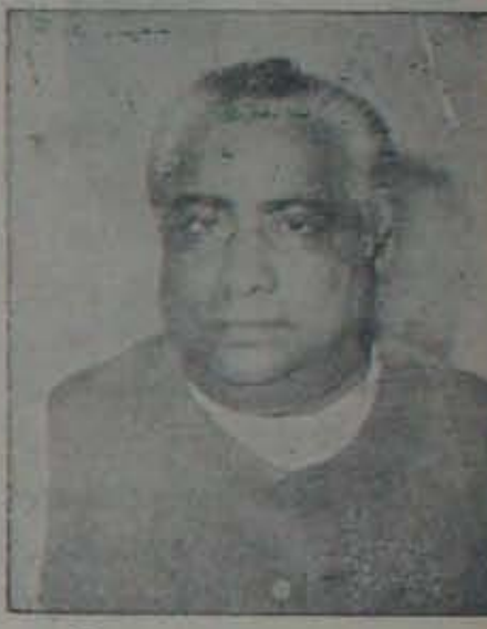
పరిపెట్టుకుంటున్నారు. వీరంకా కాని కాంపు, అక్కడ పురాణాలకంటే కాని. -కారవ 7వ పేజీలో

మాజీ ముఖ్యమంత్రి శ్రీ అంజయ్య అంటే కొండకీ సేవకావి, అలాగే వట్ట రాజకీయాని అంటే వచ్చుంది! తెలుగుదేశం ప్రభుత్వం వచ్చింది: ముఖ్యమంత్రి రామారావుగారు అప్పుడు వచ్చినట్లు వ్యవహరించాడు; తెలుగుదేశం గగ్గోలు వచ్చింది. ఈ విషయం, అసలప్పు వి కాంగ్రెస్ వాళ్లుకూడా వ్యయోగి చుకున్నాడు? వియత్నం రెడ్డిగారు తెలుగుదేశం ప్రభుత్వంలో ముఖ్యమంత్రిగా ఉన్నప్పుడు అప్పట్లో అప్పటికి కాంగ్రెస్ పార్టీ వారి కుడు చురుమోహకారం చేసేటగా, వచ్చినప్పుడు గట్టిగా ఒక్క మటా అనలేడు. కాబట్టి కాంగ్రెస్ వాళ్లుకూడా రోజులు వాడుకలవారే పరిశ్రామికవారో