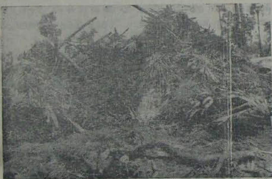
వాకాడు తాలూకా లచ్చిపాళెంలో కూలిపోయిన గుడిసెలు.

రావుల్లో, తుపానుకాకికో, నాయుడుపేట మొదలైతే, నమామో మాత్రం — గౌరవ 12 వేటిలో