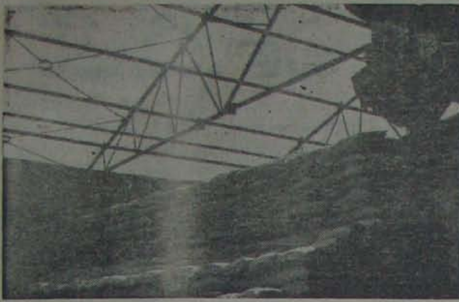
వేదాయపాశంపద్ద గోడౌన్లమీద రేకులు అయివులేకుండా ఏగిరిపోయాయి చూడండి.