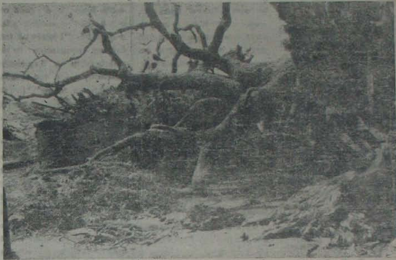
దుగరాజవట్టుం పొలిమేరలో గుడిసెమీద వెట్లు విరిగి పడింది

ఇక గుడిసెలు వరే- నామరూపాలు లేకుండాపోయాయి కప్పలు ఎగిరిపోయినవి కొన్ని; గోడలు కూలిపోయి కొన్ని; గాలిలో విక్కి, గింగిరాలు తిరిగి, చిన్న చిన్న మైవని కొన్ని; పెను గాలిలో పడి అక్షయలేకుండా కొట్టుకొనిపోయి, ఎక్కడో దూరంగా పడిపోయినవి కొన్ని.... ఈ రెండు తాలూకాల్లోవి గ్రామాల్లో ఎటు పోయిన పాతాళ్ళు రిస్తున్నాయి. పేదవాడికి పూడిగురిసే వర్షవర్షం; తనది అనుకున్న ఆ అపవిత్ర వర్ష వాళ వం చేసి, తప్పిగా వెళ్ళిపోయింది తుపాకా కక్కని వెట్లు కూలడంకూడా ఈ ప్రాంతం