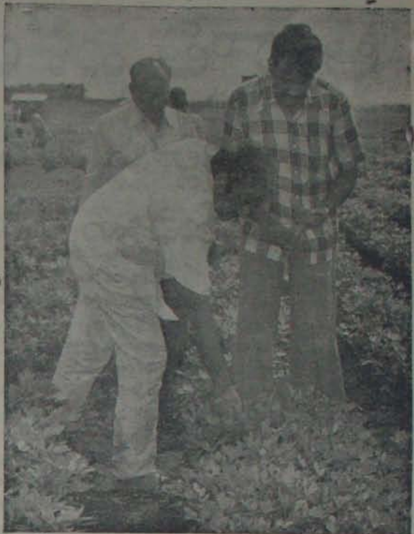
ఇక్రిసాట్ వెయిల్స్ క్షేత్రాన్ని పరిశీలిస్తున్న వ్యవసాయ మంత్రి జవహర్ లాల్ నెహ్రూ వేరుకనగ నిపుణుడు సుబ్రహ్మణ్యం ఆయనకు వివరిస్తున్నాడు వెక తర్వాతి రాష్ట్ర వ్యవసాయ వై రెక్కడ అంజనేయులునాయుడు.

వానపీచుకు ముఖంవారిపోయే, ఉష్ణ మండలపు అల్పవర్ష ప్రాంతాల ప్రపంచం లోని 50 దేశాలకు విస్తరించి వున్నాయి; వీటిమొత్తం వైశాల్యం 2 కోట్ల చదరపు