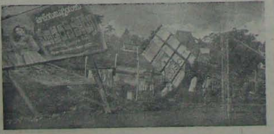
నెల్లూరు అర్. టి. సి.ఐ.స్టాండు ఎదుట ఇనుపస్తంభాలమీద విల్పిన ప్రకటనలు గింగిరాలు తిరిగిపోయాయి!

మెలికలుతిరిగి నేలకొరిగింది! యిటు వందలాది వాహనాలు బాద్ల తిరాయి. రాత్రినుంచి మర్నాడు సాయం కాలందాకా! రైల్వే లైన్లమీద వెట్టు విరిగిపడడంతో, హాయంకాలం 6-30 గంటలకు నెల్లూరు స్టేషన్ వేరాలివ హైదరాబాద్ ఎక్స్ప్రెస్ను మర్నాడు మధ్యాహ్నం 11-30 కు వచ్చింది. ఈ తుఫాను వీరత్వంలో జిల్లాకు ఎంత నష్టం కలిగింది అంకా ఒక అంపనాకు రాలేదు. ఇప్పటికీ తేచిన అంపనా ప్రకా -కొరవ 12 వ పేజీలో