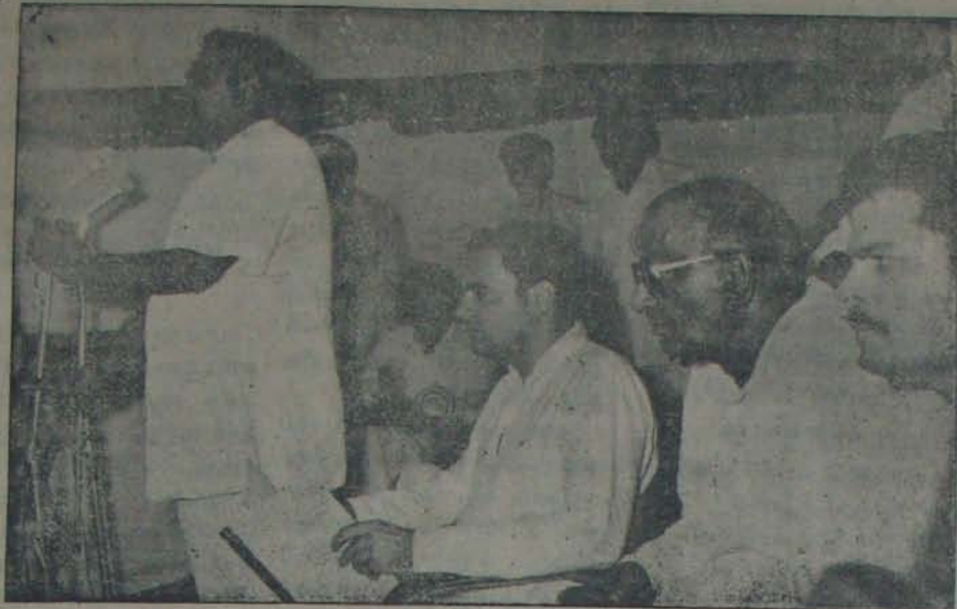
నెల్లూరు అపారంగవల్లో హ్యాగరిస్తున్న ముఖ్యమంత్రి విజయభాస్కరరెడ్డి. (ఎవరివారక యాక్ కాంగ్రెస్ అధ్యక్షుడు తరీఫ్ అన్వర్