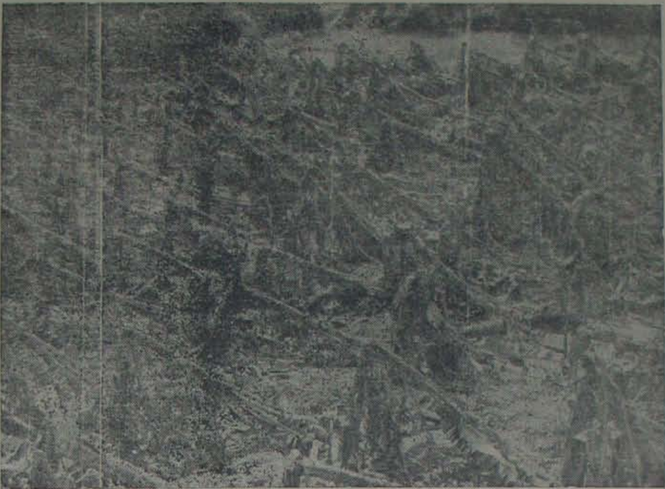
తుపాకు తునాతునకలైపోయిన ఆరటితోట