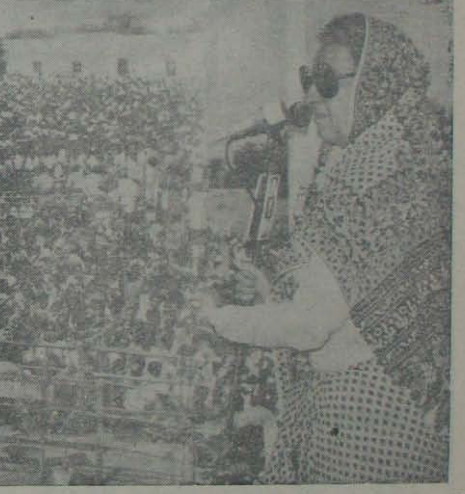
ఒంగోలు ఎ. డి. ఎం. డిగ్రీకళాశాల మైదానంలో జవనమూహంకాదు. ప్రవాహం అనిపించేట్లున్న బహిరంగసభలో ప్రసంగిస్తున్న ప్రధాని ఇందిరాగాంధీ

మరి అ మాట అనిపించకుండా ఎట్లా వుంటుంది? ఒంగోలుకు ఈవిలేఖరి వెళ్ళవచ్చాదు-