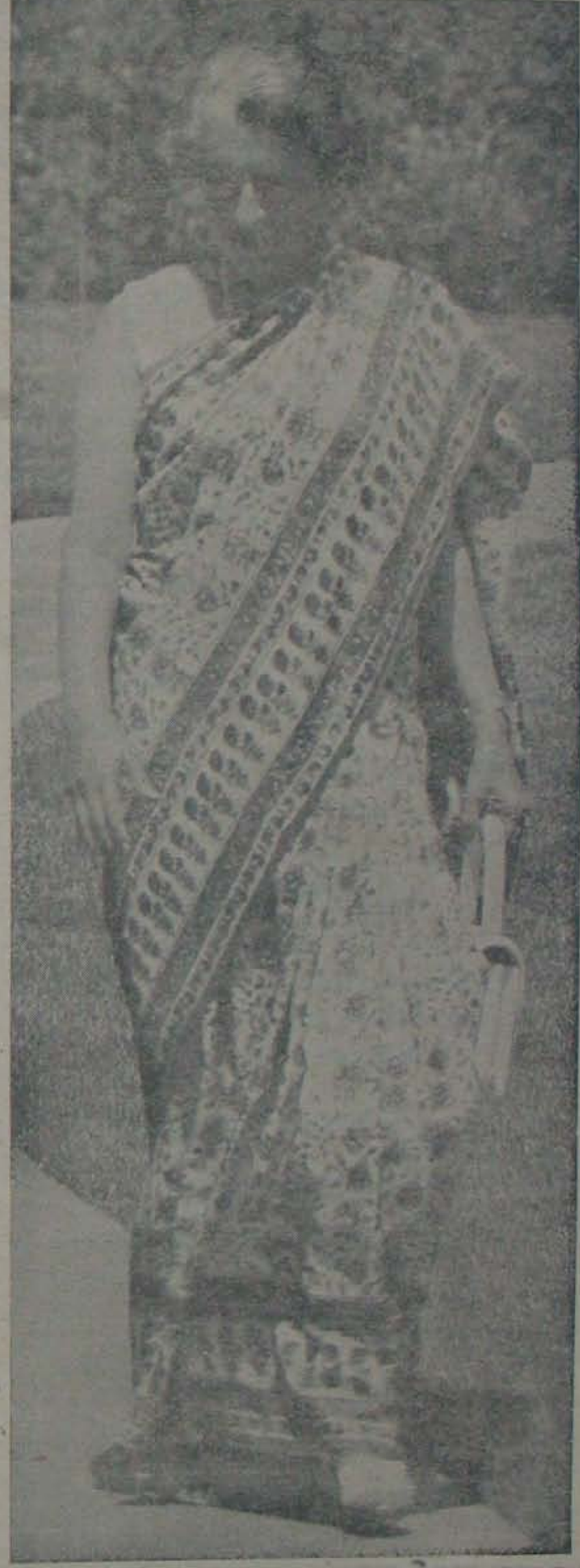
జన్మదిన శుభాకాంక్షలు (ప్రధాని శ్రీమతి ఇందిరాగాంధీ 65 వ జన్మదినం నేడే- నవంబరు 19)