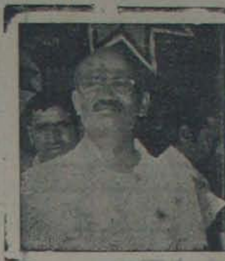
కలికి యానాదిరెడ్డి ఎం. ఎల్. ఏ.