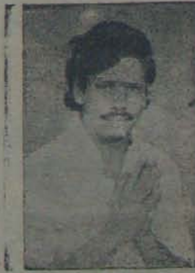
అసం వివేకానందరెడ్డి నల్లపరెడ్డి ఎ. డి. వి. అధ్యక్షుడు మునిపాక వైసీ పేర్కా