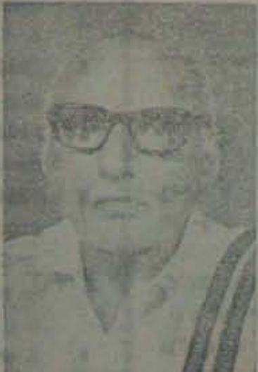
జి. తిరువతివాయిడు జిల్లావర్తమానాసాధ్యక్షుడు