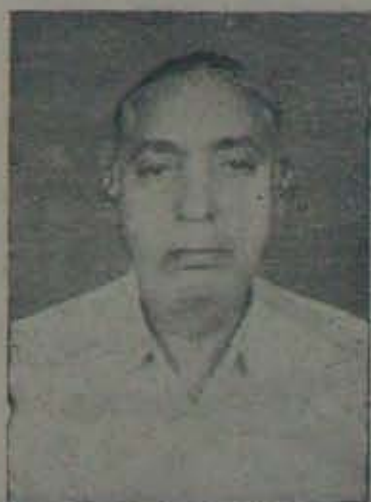
కోదాడు శ్రీరంగారెడ్డి కోపూరు సమితి అధ్యక్షుడు