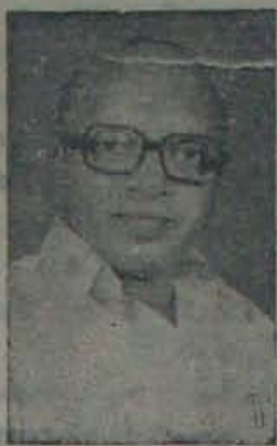
గిద్దలూరి సుందరరామయ్య ఎం. ఎల్. ఏ.