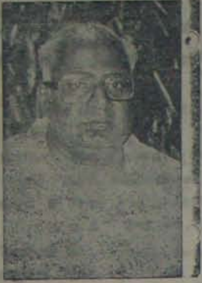
ఆనం లక్ష్మివారిదర్శి జిల్లా కో-ఆపరేటివ్ సెంట్రల్ బ్యాంకు అధ్యక్షిణి