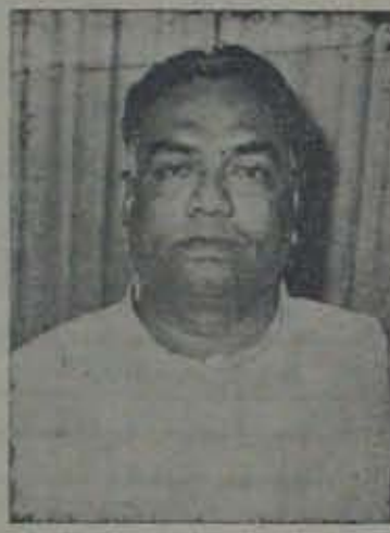
నాడు, ఒకదాం కాంగ్రెస్ ఐ. చర్యలుగా అగ్ర శ్రేణి వారు కోకదాం ఎట్లా కాకుండా

మరాఠీరాష్ట్ర కాపురం ఎన్నికలలో పార్టీ కార్యకర్తల వ్యతిరేకంగా చరిత్ర గని విసిరి అర్జునుడు శ్రీ కోన ప్ర కరరావు 37 మంది మీన దినుకొన్ని క్రమశిక్షణ చర్యలు కొత్త అర్జునుడు శ్రీ పి. దాస్ రద్దు చేశారు. ఎసి అర్జును దైవ తర్వాత దాస్ చేసిన మొదటి చర్య. కాదు వె.కె.ఎస్.ఎస్.ఆర్. కి రక్ష ణ్యం వివక్షించాడట. దాస్ వె.కె.ఎస్. ఎస్.ఎస్.ఆర్.కి రక్షణ ఇచ్చి, వారి వివక్షం హామీగా దాస్ మంత్రాంగం కృష్ణ డి కనకవరదేశిని, రక్షణ్యునిగా నియమించి ఎన్నికల సమావేశంలో పాల్గొ