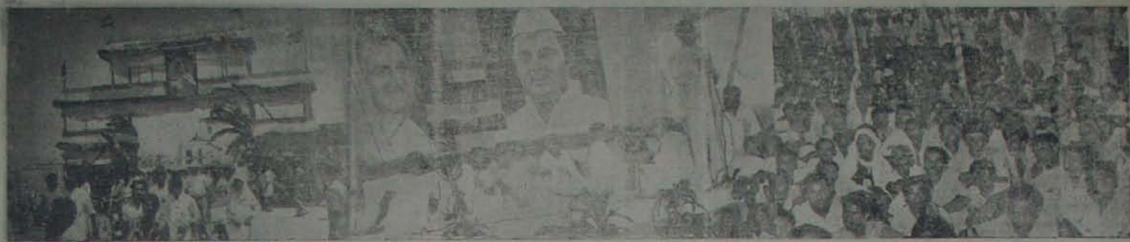
11 తేదీ నెల్లూరులో గొప్పగా జరిగిన కాంగ్రెస్ 'వర్కర్ల' సభ ఎత్తాలు: ఎడమ-గంభీరమైన ముఖద్వారం; మధ్య-తల్లితనయుల (ఇందిరా గాంధీ, రాజీవ్ గాంధీ) ఛాయలలో వేదిక మీద పెద్దలు, పువ్వునిస్తున్న కేంద్ర అధ్యక్షులు ప్రజావే ముఖ్య; కుడివైపు-ఇసుక వేస్తే రాలనంతగా హాజరైన కాంగ్రెస్ అధిమానులలో ఒక భాగం.