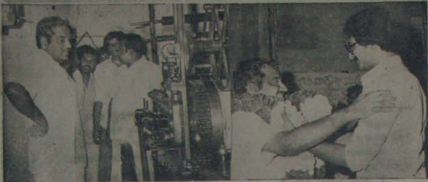
15 తేదీ 3, ఆర్. ప్రొటెక్ట్ ప్రారంభోత్సవం జరిపి, మెడినరి చూస్తున్న రెవిన్యూ మంత్రి జనార్దన్ రెడ్డి - ప్రక్క చిత్రం: ఘంటసాలలో తనకు స్వాగతం చెప్పిన ప్రెస్ యజమాని కోవలరాంను హార్టికంగా ఆధిపందిస్తున్న జనార్దన్ రెడ్డి.