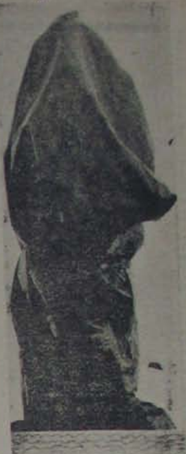
ఎవరి ముసుగు పీకడు? (4 వేడి చూడండి)