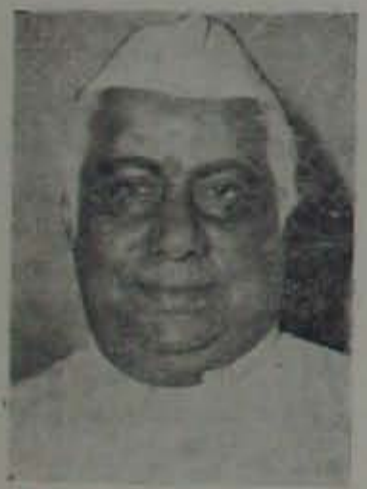
శ్రీ బి. ఆంజయ్య ముఖ్యమంత్రి

— శ్రీ వివేకానంద సేవా సమితి సభ్యులు, ఇందుకూరు పేట.