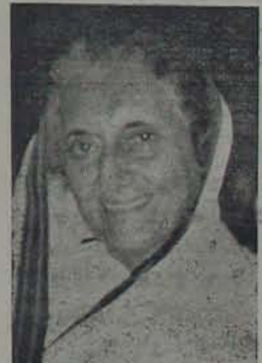
శ్రీ మతి ఇందిరాగాంధీ ప్రధానమంత్రి

ఆంధ్రప్రదేశ్ రాష్ట్రం ఏర్పడిన తర్వాత గత 16 సంవత్సరాల కాలంలో అత్యధిక సంఖ్యక ప్రజలకు విస్తృత స్థాయిలో విద్యా సౌకర్యాలు కల్పించడంలో మాన రాష్ట్రం అగ్రగామిగా ఉంది.