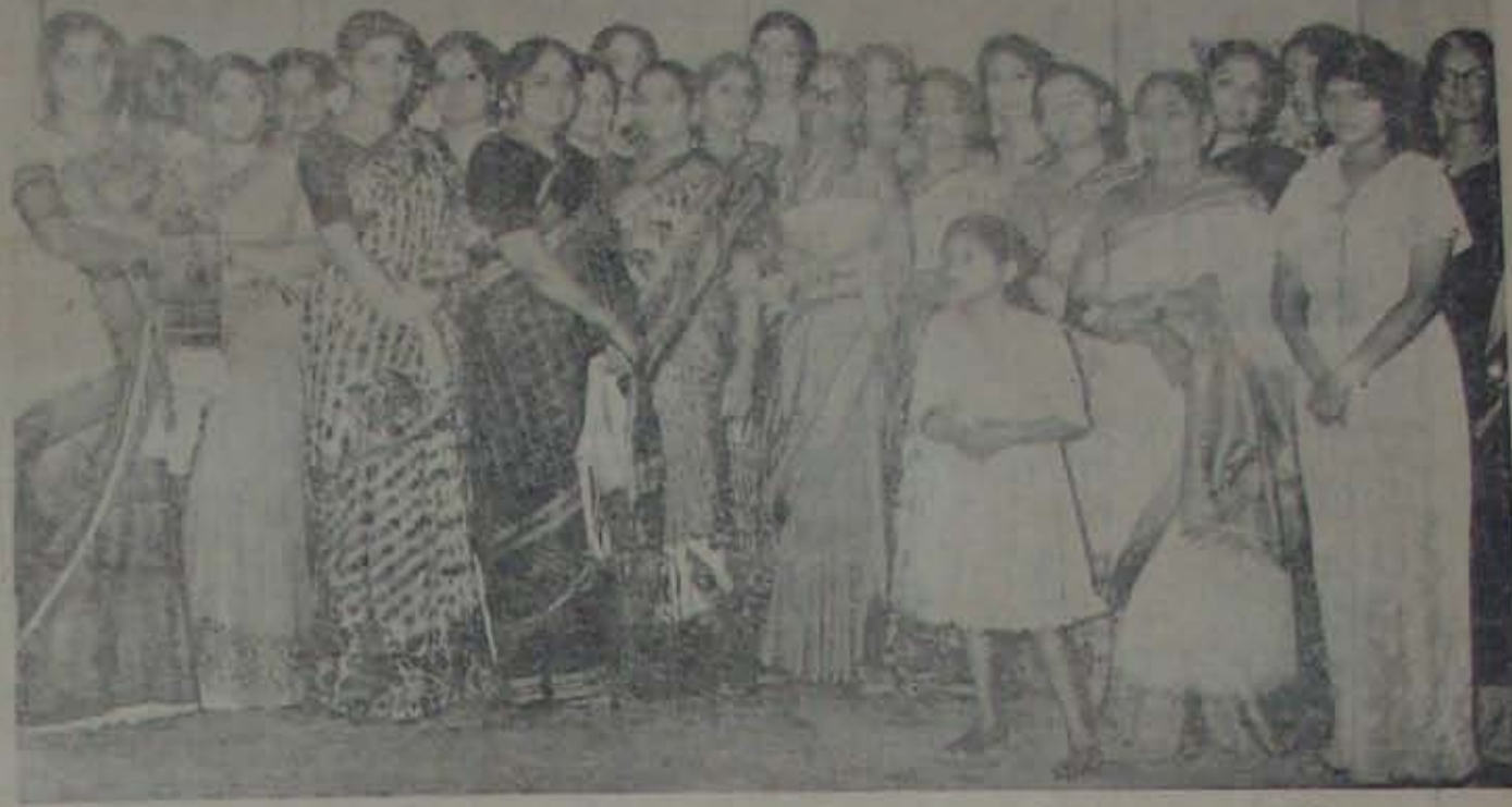
24 తేదీ లిక్క-వరపు సుదర్శనారామయ్య కళాకారవనంకోర్టువల్ల 'దిగాడి విడుదల'గా సన్మానమండలికొన్ని చాలివందూకతో సహజావందరి నటులు. ఈ ప్రముదావనంలో వరపున చేరితే నందీతో, కళ్ళిద్దారో పున్నామే మారినవందూక.

వగరాలలో ఎక్కువగా నిమ్మకాయల ఎగుమతి అవుతుంది. ఈ సారి డి.బి.ఆర్. నిమ్మకాయల ఎగుమతికి అవరోధాలు ఏర్పాటు చేసింది. రైల్వే వ్యాగవ కౌన్సిల్ అంగిళ్ళలో నిమ్మకాయల ఎగుమతికి అవరోధాలు ఏర్పాటు చేసింది.