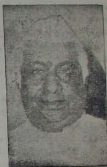
వరదాని, పార్టీ బీకెట్లు యివ్వకుండా యలాచేయడం అనేవిధిని ప్రస్తావించి కాంగ్రెస్ ప్రతినిధులు మామూలు తననే —కారవ 10వ పేజీలో

వారనేది తెలియకాంగ్రెస్ బలోపేతక అనేది పెరుగుతోటకారలో పెరుగు వంటిది. దబ్బువకావం లోగడ ఎన్ని కలకంపే యిలాపెరిగిపోయింది. ముఖ్య మంత్రి మాట వినేమంత్రి ఎవరులేరు. ఎవరిదారివారిది. మంత్రిలవరూ ఎన్నికం ప్రచారంలో పాల్గొనరాదని ముఖ్యమంత్రి అన్నారు. వెంటనే తెలిస్తే తెలియకా అధికారపూర్వకంగా కారను వాదనా దన్నారు. అంతే పాల్గొన్నవారు అధికార కారను వాదననేగా రాజధానిలో మంత్రి ఎవరూ లేకుండా ఎన్నికంలో విమర్శలు అధికార దుర్వినియోగం బాగాచేసారు. విప రీతంగా హామీలు అచ్చారు.