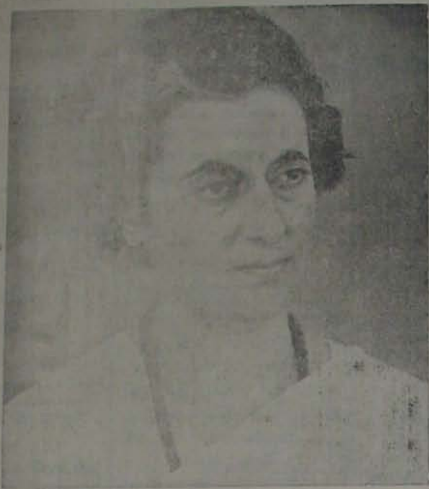
ప్రధానమంత్రి శ్రీమతి ఇందిరాగాంధీ