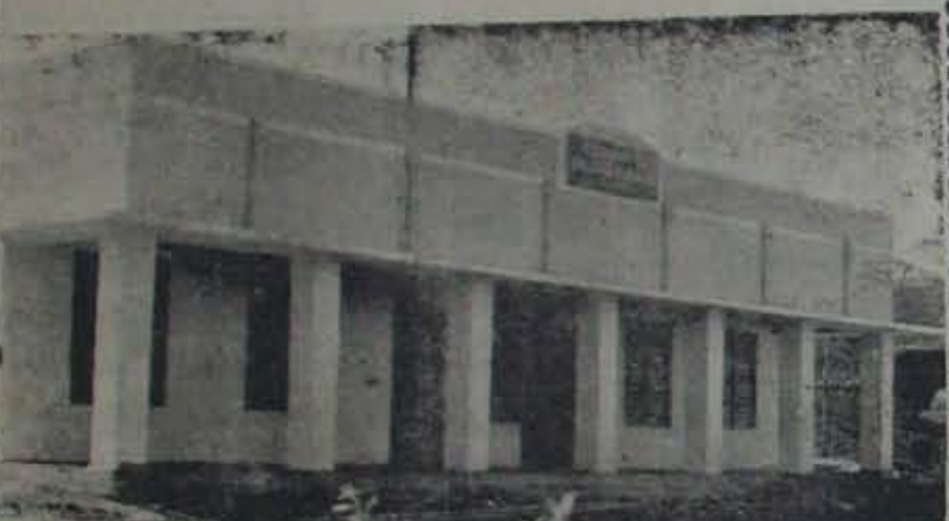
మా గ్రామములో ఉన్నత పాఠశాల భవనము లేని కొరతను 10 వేల రూపాయలు దానమిచ్చి భవనము యేర్పరుటకు సహాయము చేసిన