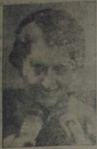
ప్రధాన మంత్రి ఇందిరాగాంధీ