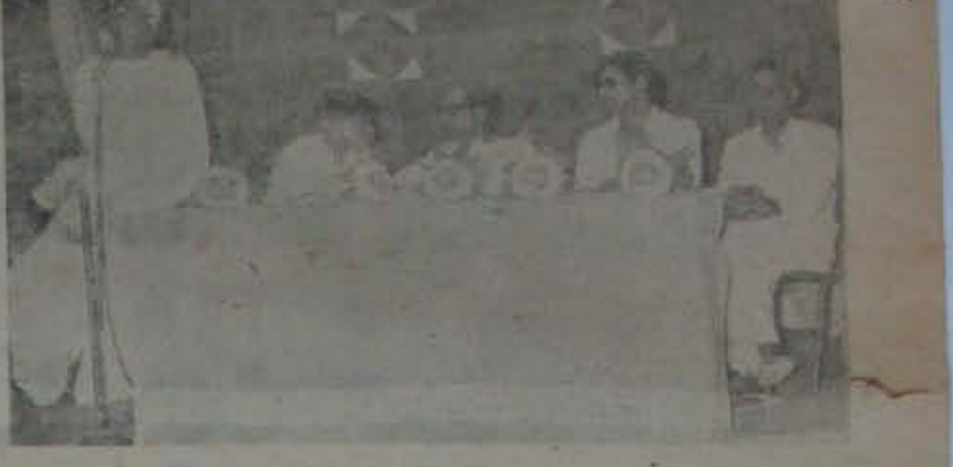
రామమూర్తిస్వర్ ప్రవేశి రీకంగ యం ప్రారంభోత్సవ సభలో మొదలుముద కొండ రామమూర్తిస్వర్ ప్రవేశి రీకంగ మూర్తిస్వర్ వాగార్థి హరిశ్చంద్రస్వర్. ఆనం వివేకాచంద్రస్వర్, తి. కం. ద్రాస్వర్.

పనికి ఆపారం (2వ పేజీ కొరవ) ఇందుకుంటేల సమితిలో ఎక్కువగా వుంది వివరాలు అందిన తర్వాతకాని, దృక్పథం చెప్పలేము. నియం విషయంలోనేకాదు, ఇంకా అనేక పథాలకు సంబంధించి కూడా ఇ దు కూరుపేట సమితిలో అనేక ఆధికంగా వున్నట్లు అనుకోలున్నాడు. నీటికి సంబంధించి కూడా ఏవరాలు అంద నరనివుంది. క్రింద ఉద్యోగులను వేడి చదం, నీటి చదం, వేపుకొనడంకూడా జరుగుతున్నదంటున్నారు. వాళ్ళలో అనం త్యుప్తి, అందోళన తీవ్రంగా వున్నాయి. పోయిన డి. డి. ఓ. విషయంలోనే హా కారాల విషయం లేదాయె. ఇప్పుడు ఈ యి కంటే అయినే పేలు అంటున్నారు. ఈ సమితికి ఏనాటికి కావనిముక్తి కంటే లేదు