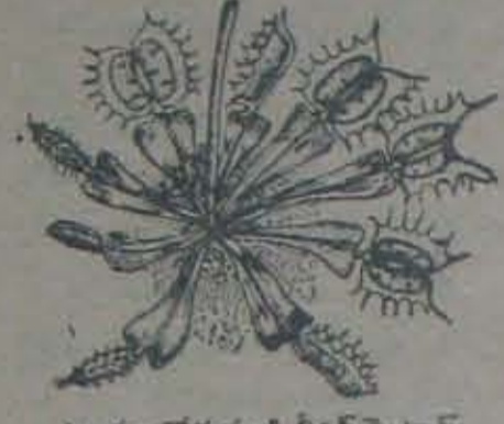
ఎలకల బోనువంటి వీసన్ పైట్రావ్

దీని అతులముట్టా నన్నటి వెంట్రుకలు వరచుకోవటం. వాటిమీద మంచు వించువేమాదిరి రసం ఒకటి మెరుస్తూ వుంటుంది. అదేవో శేనెబొట్టలని భ్రమ వదిల పురుగులు, కీటకాలు ఆట మీ ద వారితే, ఆ వెంట్రుకలన్నీ కుక్క పా రి