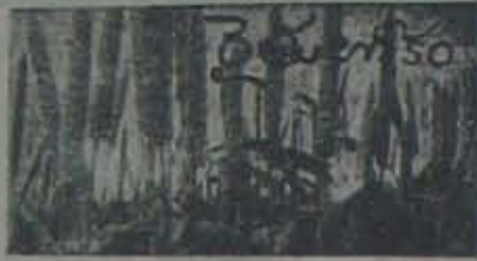
సొడుగు మిరప రకం

55 రెమన్, (ప్రైపోలిమెట్) నిమ్మ రకాలను కలిపి మరొక కొత్తరకాన్ని ఈ విశ్వవిద్యాలయంలో రూపొందించారు. ఈ రకాలు బ్రహ్మాణ, పైలో ఫోల్డా వంటి తెగుళ్ళను తీటునుంటాయి.