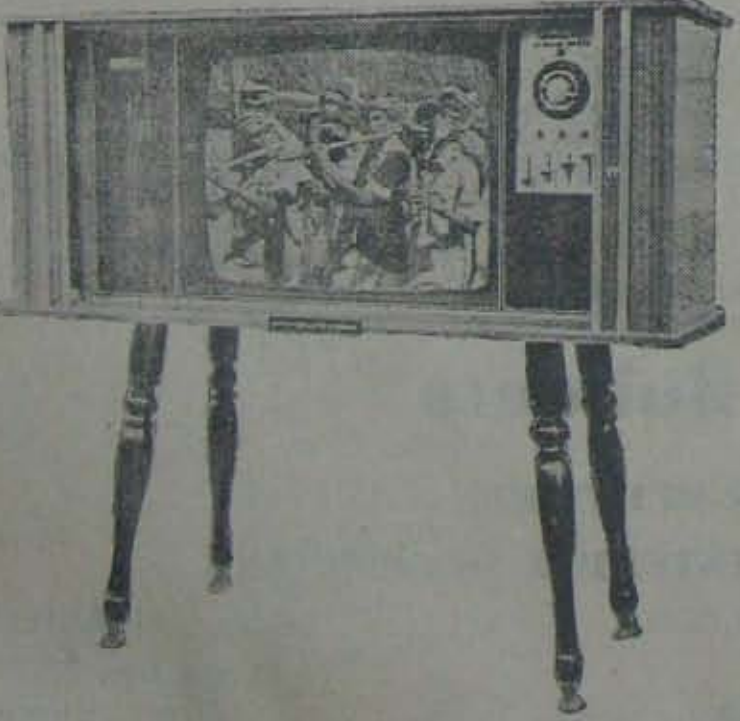
నెల్లూరు చిత్తూరు జిల్లాలకు ఏకైక ఆఫర్లెక్ట్ డీలర్ :