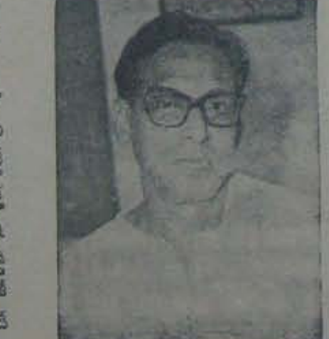
రేపటి వలస వారిలో ఆత్మవిశ్వాసం పూర్తిగా పడలిపోయి గత్యంతరంలేదనుకున్నారేమో, కడకు రాజీనామా నిర్ణయానికి వచ్చినట్లు అనుకోవలసివస్తున్నది.

విరమించుకున్నారనుకున్నాము, రెండు ఓటములు పొందిన తర్వాత జిల్లాలో రాజకీయంగా మరి పతనంపొందిన తర్వాత