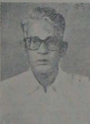
మా ఇంటి వెలుగు