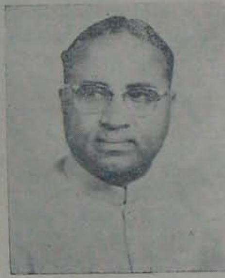
నిన్నటి వలస పార్టీలోని అనసంఘం తప్ప, రాష్ట్రంలో మరే ఇతర ప్రతిపక్షమూ పేరుకూడా మిగలదా అనిపిస్తున్నది. అసెంబ్లీ, కౌన్సిల్

ఇం. కాం. లోకి వస్తున్న వలస చూస్తుంటే, కమ్యూనిస్టు పార్టీలు, అనకా