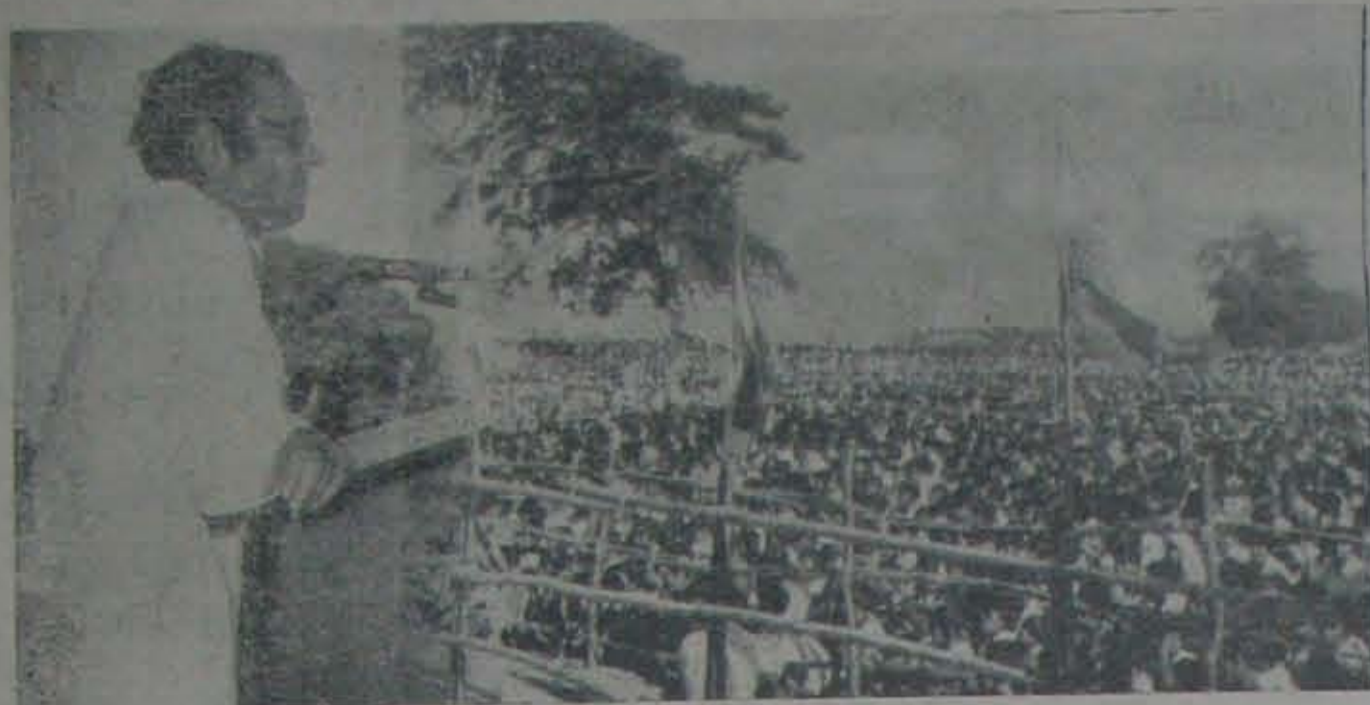
1978 డిసెంబరు 26 తేదీ నాయకులపేట వేదిక మీద ...

కుపాకా బీదర్లను తిరించడానికి వచ్చిన సంజయ్ కి ఆనాడు నెల్లూరుల్లా బ్రహ్మరథం వట్టెంది.