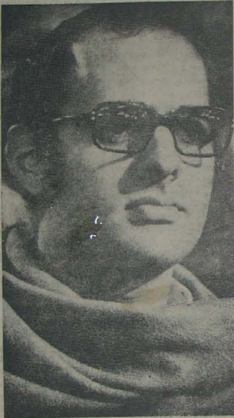
ఉదయవేళనే అస్తమించిన ఉదయభానుడు