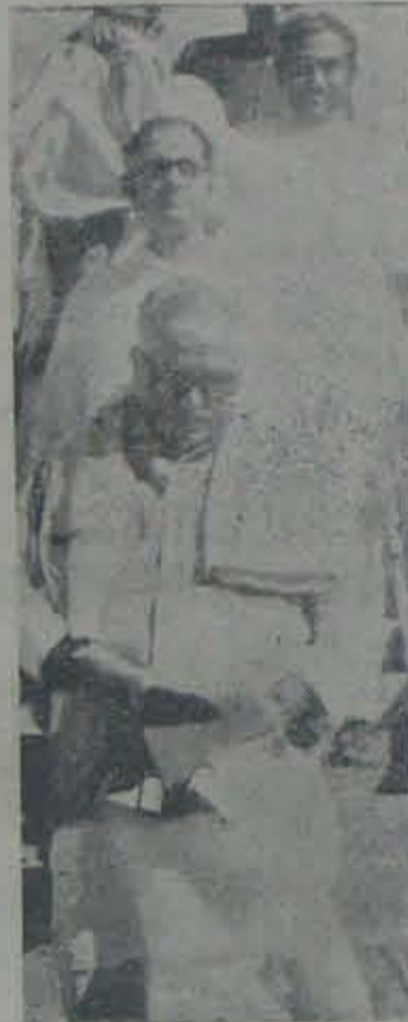
నాయకులపేట వేదికనుండి దిగివచ్చిన నాటి ముఖ్యమంత్రి వెంగళరావు, సంజయ్ గాంధీ, జనార్దనరెడ్డి

ఇందిరాగాంధీకి చేతికందివచ్చినకొడుకు మాత్రమేకాదు సంజయ్ ఇటీవలికాలంలో ఆమెకు రాజకీయాలలో, పరిపాలనలోనూ సలహాదారు, సా.తి, హృదయవయిత కూడా. ఉన్నప్పుడు అవ్యాయువువయ్యాగా తిరిగి సంజయ్ 1976 ప్రాంతాల నుంచి రాజకీయాల్లో ఉద్బాహం కనం ర్పాడు.