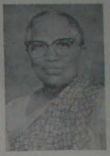
కానవమందిరి సట్టుకాల కాబోతున్న సిస్టర్ ఎటెర్

ఈ ప్రమాదంలో మరణించినవారందరి కుటుంబాంకు ఇనూరెన్సీవారు పెద్దమొత్తాలే ముట్టజెప్పబోతున్నారు.