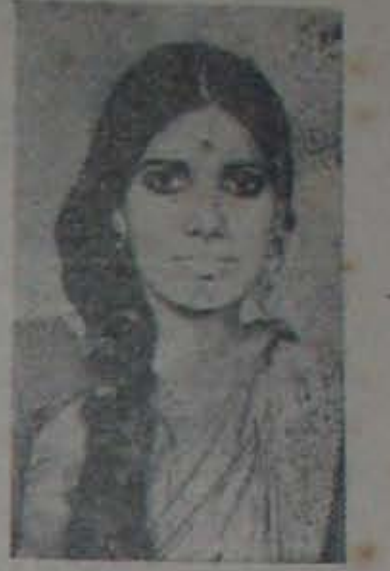
జననం : ఆగస్టు 5, '54 మరణం : జూన్ 14, 79