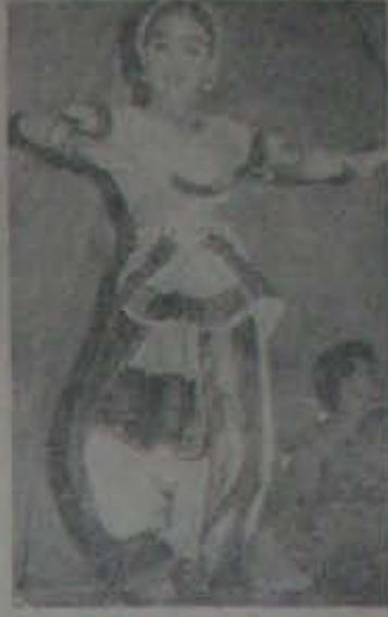
కోపూరు తిరునాళ్లలో ద ర తి వాట్యం చేసిన దాం కళాకారిణి స్వరూప.

మునిసిపల్ ప్రాంతంలో ఇళ్ళు కట్టు నెల్లూరు —ది మల్లిభార్తున్ కోవారంపే, ముందుగా మునిసిపాలిటీ *