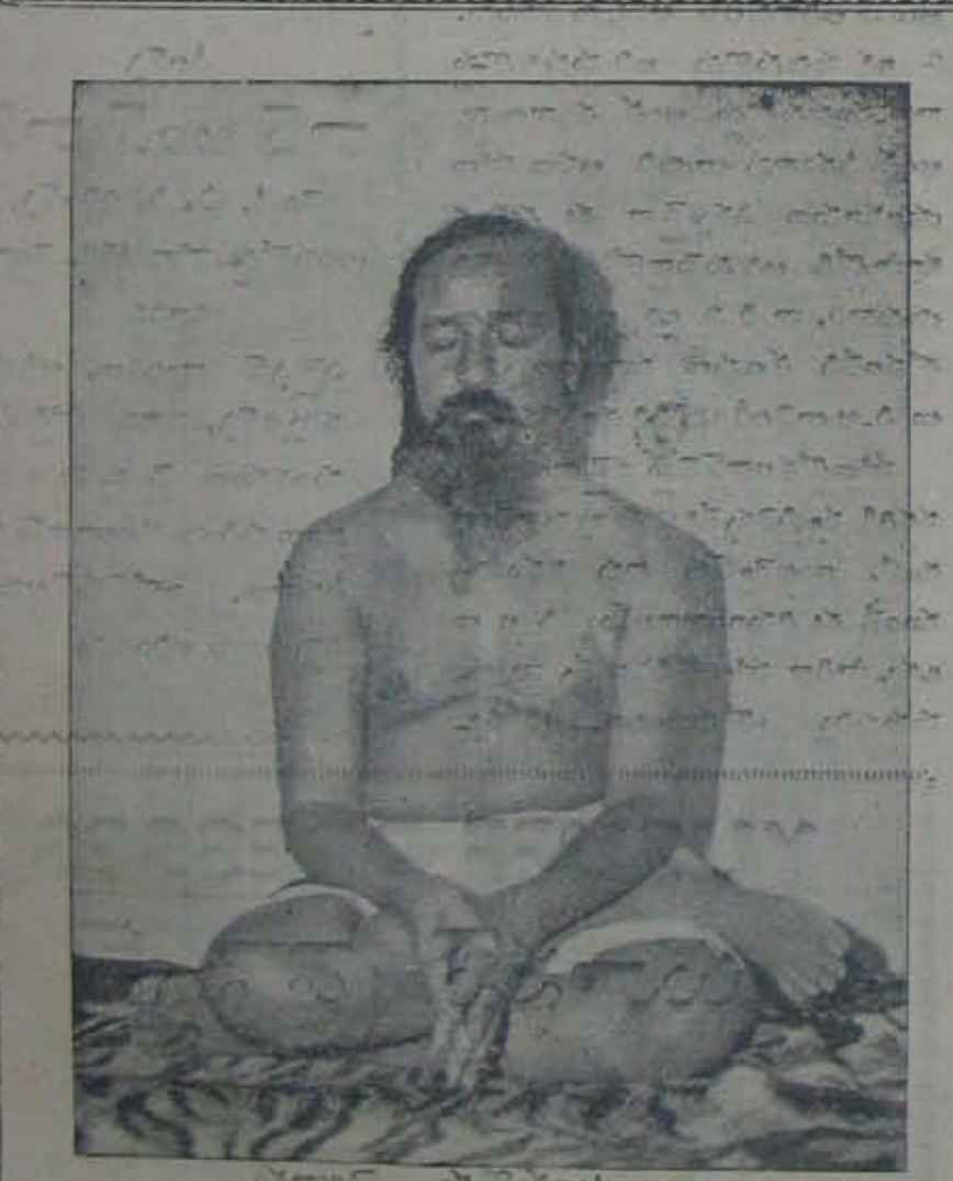
జననం : 23-10-1930 తపస్సు ప్రారంభం : 22-8-1948

ఇది కోతలా సీమన్, కాబట్టి, నెల్లూరులో వీళ్ళు ఇంకా అలాకొలా మిలింపున్నాయి కాబట్టి కలుకు అంతగా ఇచ్చింది అన్ని రకం రేకులూ, అమ్మలూ, లాటిల్ యజమానులు కూర్చోని సాయాకన అను ర విస్తున్నారు. కొన్ని మాటల్లో చివరకు నిర్మిచేయాలన్న పరిస్థితి ఎర్పిటివంది. ఆర్గ్నాద సమ్మె సదుపాయం, ఒక అప్పం దానికి వచ్చే రకం ఈ రెంటా తప్పేట్లు లేదు.