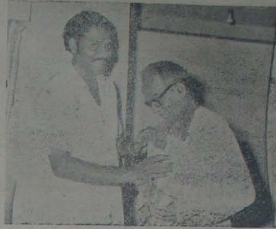
ఘంటసాల వల్లం వద్ద గా 11 తేదీ సినీ సంగీత దర్శకుడు పెద్దాం నాగేశ్వరరావును సత్కరిస్తున్న 'సినిమా' సుధాకాశి

అంతేకాదు, మనోన్న ప్రశ్నలకుకూడా ఈచిత్రం చక్కటి సమాధానమివ్వగలదు. నలుదంటే ఎవరూ ఉత్తమనటనకు ప్రమాణాలు నటసామాజ్, నటరత్న ఇత్యాది దీరుదలాలి? లేక నలునకిగల సత్తా, చిత్రకర్త, ప్రతిభా పగైదలాలి? పాత్రలో రాలించదానికి, జీవించదానికి, రీసమైకోవదానికి శేధాపిమిటి; ఇటీవలికాలంలో అమూలనదాన్ని మనం చూచిన గుర్తున్నదా; -కొరవ 10వ పేజీలో