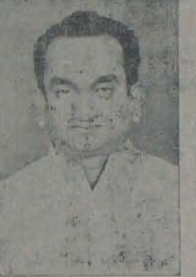
ఒక్క ఒరలో రెండు కత్తులు ఇముడుతాయా?