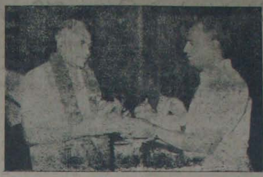
28 రోజుల అంతర్ధానం తర్వాత ఆయనకు 28 రోజులుగా అంతర్ధానం ఉంది.

ఆయనకు 28 రోజులుగా అంతర్ధానం ఉంది. ఆయనకు 28 రోజులుగా అంతర్ధానం ఉంది. ఆయనకు 28 రోజులుగా అంతర్ధానం ఉంది. ఆయనకు 28 రోజులుగా అంతర్ధానం ఉంది.