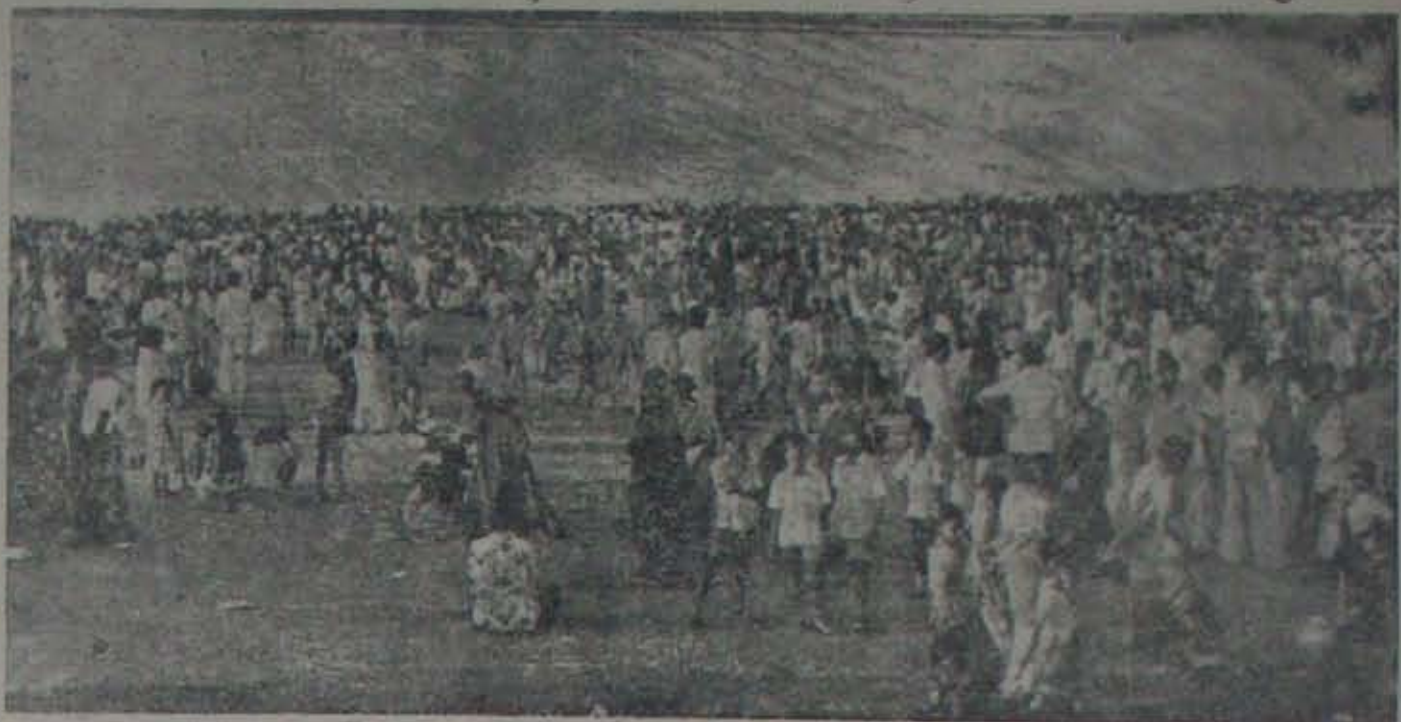
నెల్లూరు కలెక్టరేట్లో పుచ్చారంపేటలో జరిగిన రోజుల పండగలో జనసందోహం.

వెల్లూరు 871 మందికి 57 మంది వీరిలో గ్రామీణులు కలారు. కాటాకా బోర్డు మొత్తం 10,000 ఓట్లకు ఎక్కువ కావరి కావాలి. దానిలో 388 ఓట్లు 54 మంది, పోలవరంపాడులో 385 మందికి 32, కొమ్మిలో 650 మందికి మొత్తం మొగ్గు, జలంపేటలో 527 మందికి 54 గురు, ఇక అదిమూర్తి పురంలో 282 మందికి ఒక్కరూ ఓటు చెల్లలేదు. కలిగిలో 387 మందికి మొత్తం కాని, కావరిలో 854 మందికి 358 మంది ఓటు చేశారు. కావరి పెద్ద కెటాకా నాయకులు జనీవను వరించారన్న మాట. ఏ పార్టీ అధికారంలో ఉంటే దాన్ని అధికారం చేశారు అని అంటుంటే ఇక్కడ వుంది. గూడూరు మేల 650 మందికి 26 మంది ఓటు చేశారు. మరి, నెల్లూరు బొనుగూరు పోలైంది తొమ్మిదివేలే!