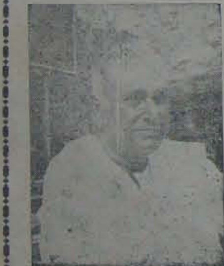
కల్లాకపటములేని వ్యక్తి, రైతునేత